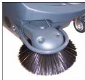
Protezione in acciaio spazzola laterale Steel protection for side brush