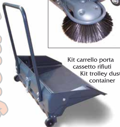
Kit carrello porta cassetto rifiuti Kit trolley dust container