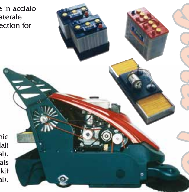
Kit cinghie trapezoidali (optional). Trapezoidals belts kit (optional).