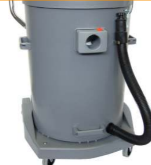
Kit scarico rapido Hose drain kit