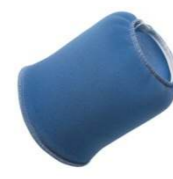
Filtro in spugna Sponge filter