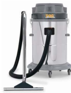
A58.3 WD A58.4 WD