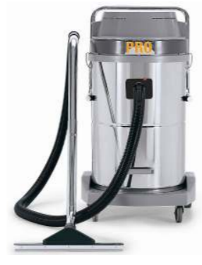
A58.3 WDB A58.4 WDB