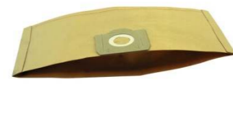
Sacchetto doppio strato Dual layer paper bag