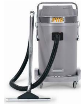
P58.3 WDM P58.4 WDM P58.3 WDB P58.4 WDB