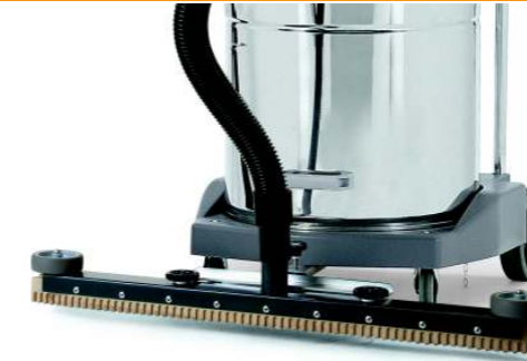
Accessorio fisso frontale Front mounted squeegee