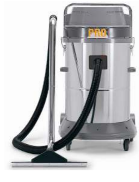
A58.3 WDM A58.4 WDM