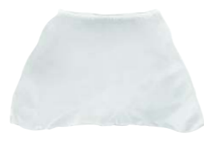
Filtro in nylon Nylon filter