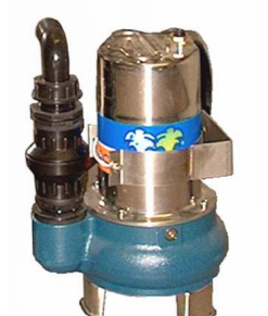
Pompa di scarico di grande portata High water flow evacuation pump