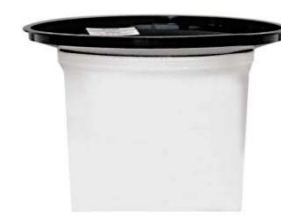
Filtro in stoffa permanente Permanent cloth filter